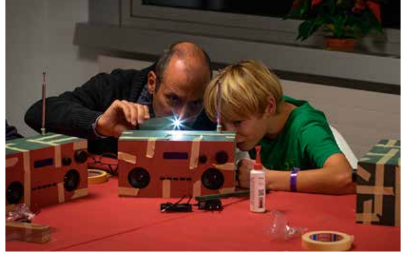
Sco vair pigliasis è sa mussà il lavuratori per construir in radio DAB+ che RTR ha offrì durant la «Sonda lunga».