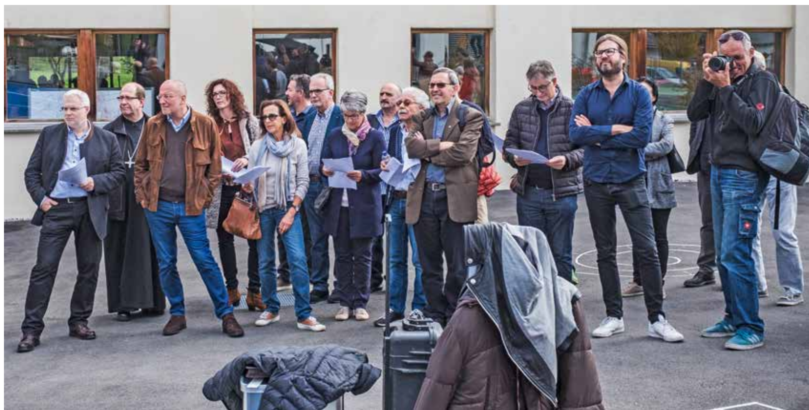
Ils 30 da settember èn represchentants da la cultura, da la politica e da las medias vegnids infurmads a Sagogn davart il project «Amur senza fin».