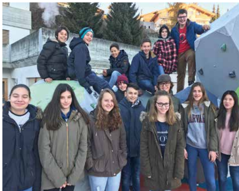
La segunda secundaria da la scolaviva Laax ha fatg il program da musica dal RR da venderdi, ils 15 da december 2017, a partir da las set la bun'ura.

il program dal RR. Las classas che sustegnan la redacziun da musica il december èn da las scolas superiuras da Casti, da Favugn, da Laax e da Zuoz. Lur musica resuna ils 1, 8, 15 e 22 da december sin las undas rumantschas. E sche Vus avais mirveglias tge chaus che han fatg quella playlist: ils scholars sa preschentan gist sez en in curt video. Da vesair sin rtr.ch.