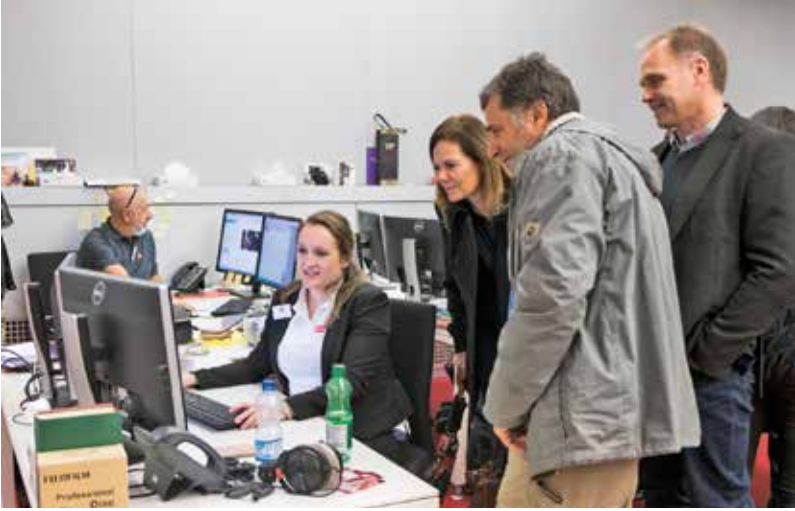
Tge stgais sa zuppan en l'archiv da RTR? Ils visitaders da la «Sonda lunga» èn vegnids infurmads ed han pudì far retschertgas extendidas.